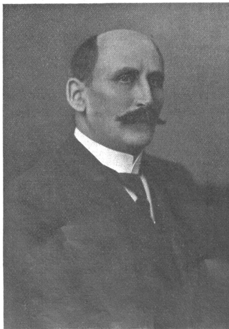
Bundesrat Dr. Felix Calonder.

Läßt man aber die regionalen Interessen ganz außer acht, was vom rein nationalen Standpunkt aus das einzig Richtige ist und was stets ausschlaggebend sein sollte, so befriedigt die getroffene Wahl in hohem Maße. Ja sie wird im Volke draußen ein freudiges Echo finden, denn der Name Calonder hatte schon längst einen guten Klang! Mit ihm wird der obersten Exekutive unseres Landes neuerdings ein Mann zugeführt, dessen Tüchtigkeit und staatsmännische Eignung allgemein anerkannt wird. Dr. Felix Calonder ist romanischer Junge und mit seiner Wahl sind nun zum ersten Mal seit