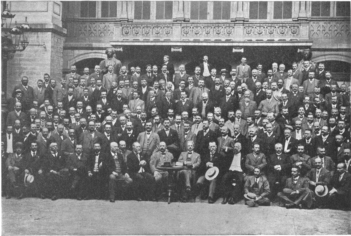
Auslandreise des Berner Männerchors: Vor der Liederhalle in Stuttgart.