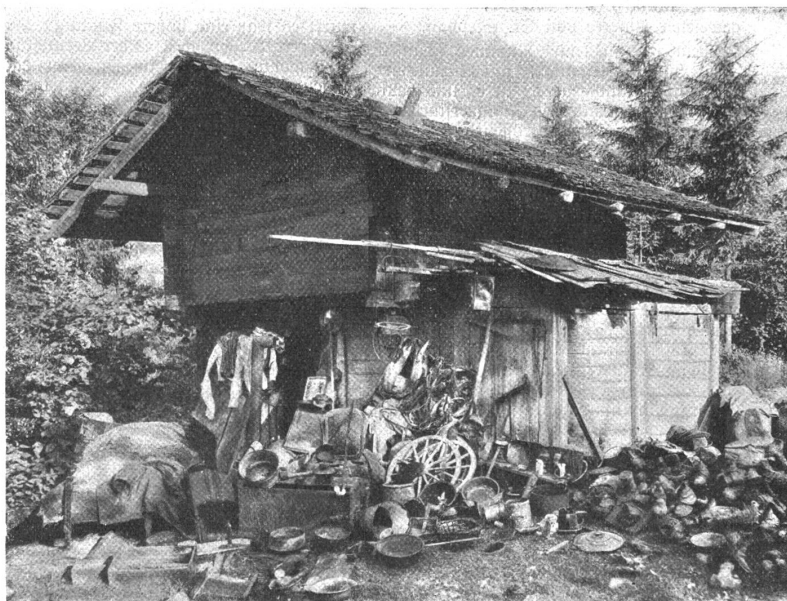
Der Wohnsitz eines Sonderlings, der hier mit 11 Ziegen zusammenlogierte.

Wir sind versucht — es möchte dies als Rechtfertigung dieser Publikation gar nicht so überflüssig sein —, unserm