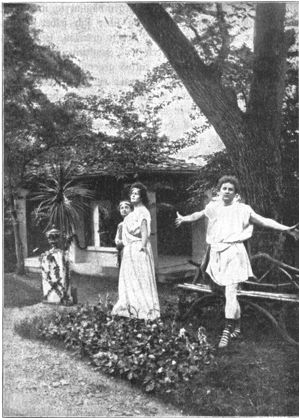
Freilichttheater in Bertenstein. Szene aus „Sappho“. (Text hiezu auf Seite 238.)

ging, seinen Rat zu erfragen, wie sie den Knaben studieren lassen könnte so, „daß es nichts tät' kosten“. Der Dechant von Birrfeld wollte ihm Unterricht in Latein erteilen. Peter kam zu diesem Zwecke nach Birrfeld zu einem Bauer. Er hielt es nicht lange aus. Das Heimweh trieb ihn schon nach drei Tagen nach Hause. „In jenen Tagen“ — so schreibt der Selbstbiograph — „ist mein Heimweh geboren worden, das mich seither nicht verließ, auf kleinen Touren wie auf großen Reisen in Stadt und Land mein beständiger Begleiter war und eine Quelle meiner Leiden geworden ist.“