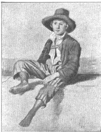
Peter Rosegger — der Waldbauernbub.

Ehre und Ruhm genoß Peter Rosegger mehr als je einem lebenden Dichter vergönnt war. Mit seinem ersten Buch war er berühmt; zwei Universitäten (Heidelberg und Wien) schenkten ihm den Doktorhut, sein Ruhm führte ihn an die Tafel von Königen, sein Name klingt in Millionen Herzen vertraut und lieblich. Seine Popularität ist geradezu einzigartig: Ein armes Bauernhüblein, ein schwächlicher Schneidersohn kommt hinunter in die Stadt und macht so von sich reden, daß alle Welt den Berg hinaufsteigt zu der einsamen Alp, das armselige Haus mit seiner rauchgeschwärzten Stube zu sehen, worin der Waldbauernbub geboren wurde. Sein Sommerhaus in Krieglach und sein Haus in Graz sind Wallfahrtsstätten geworden für sensationslüsterne alte und junge Menschenkinder.