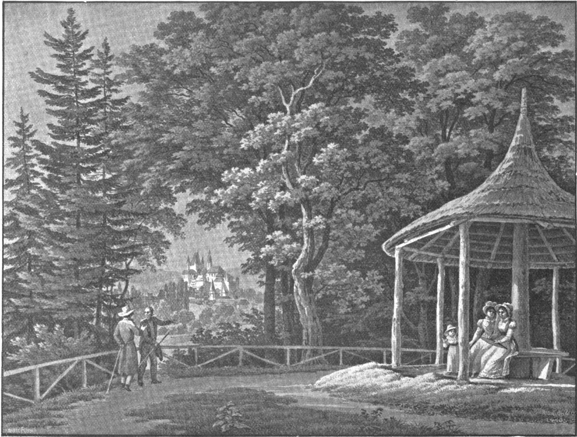
Im Bächihölzli: Blick auf Chun. (Nach Sept Zeichnung von Jacques-Henri Jullierat.)

Jahre der Helvetik verbunden, ein einfaches Denkmal. So ganz umgestaltet, erhielt der neue Besitz auch einen neuen romantischen Namen, den Vorbesitzer und Bauart bestimmten: die Chartreuse.