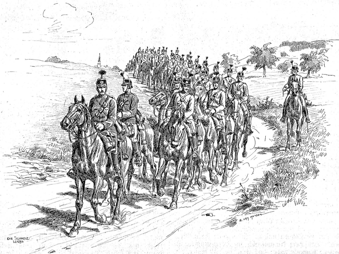
Bilder aus der schweizerischen Armee: Dragoner auf dem Marsche.