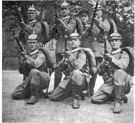
Deutsche Militärbilder: Garde-Füsiliere.

Und unter Verwünschungen oder Tränen, unter Bitten