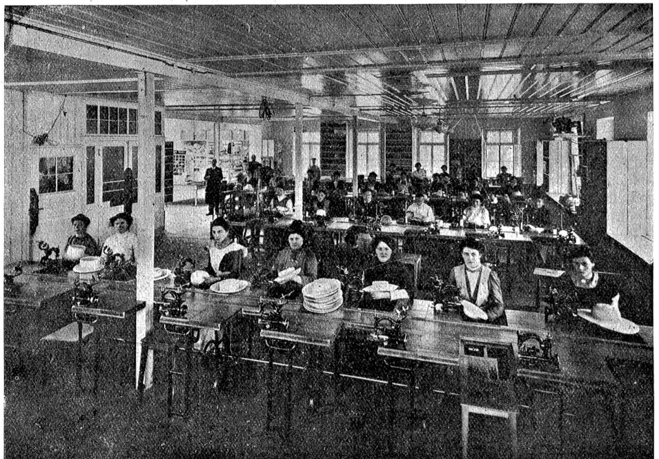
Bilder aus der Strohhutfabrikation: Nähsaal der Firma H.-G. J. J. Sijchers Söhne in Dottikon.

Kehren wir zu den wunderbaren Kunstgebilden aus Rohhaar und Strohcordonnets zurück, die schon 1896 in Genf hohes und berechtigtes Aufsehen erregten, und die heute sozusagen aus dem Handel fast vollständig verschwunden sind. Gleich im ersten Fenster des achteckigen Pavillons sehen wir eine sorgfältig getroffene Auswahl mustergültiger