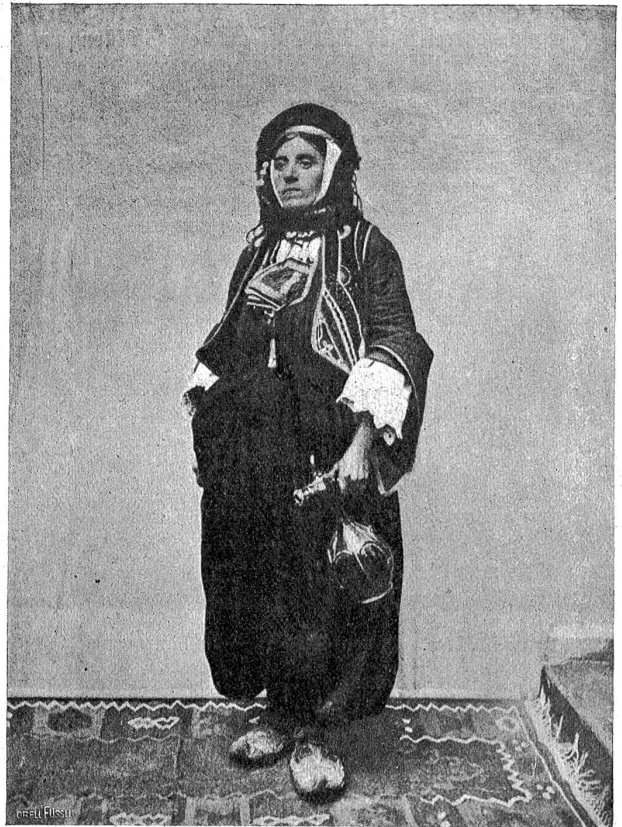
Bosnische, christliche Bäuerin in türkischer Tracht.

Die Neustadt, seit dem furchtbaren Brande von 1879 vollständig neu aufgebaut, ist, wie jede andere Stadt mit guten Straßen, Gärten und Staub. Wer aber von der breiten Anlage Jung-Serajewos ein wenig seitwärts geht, kommt unvermittelt mitten in den Orient. Ueber das Geröll der elenden Gassen finden wir in die Carsija (Scharfscha), dem türkischen Marktplatz und wohl interessantesten Orte der Stadt. In einem wahren Durcheinander schmaler Gäßchen pulsiert hier das Leben eines Basars, wie ihn Kairo nicht origineller und seltsamer aufweisen kann. Es gibt kein orientalisches Handwerk, das hier nicht vor den Augen der ganzen Welt getrieben wird: mit übergeschlagenen Beinen arbeitet der Schuster neben dem Goldschmied, der Sattler