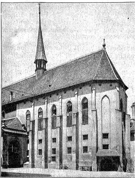
französisische Kirche: Chor vor der Restauration.

Von der ganzen Klosteranlage ist, wie gesagt, nur die Kirche stehen geblieben. Sie ist in gotischem Stile erbaut und zwar nach dem Grundriß, der ihr heute noch, trotz vielfacher Umänderungen im Laufe der Zeit, eigen ist. An das dreieckige mit flacher Holzdiele gedeckte Schiff schließt sich im Osten ein Chor an, auf dem ein schlankes, unscheinbares Dachreiterchen sitzt. Das Chor war von jeher durch einen Lettner von der übrigen Kirche abgetrennt. Unter diesem Lettner fanden fünf Altarkapellen Platz, die dann der Reformation weichen mußten. 1528 wurde das Chor durch eine Mauer ganz von der Kirche abgeschlossen und durch Einfügung mehrere Etagen als Kornmagazin verwendet. Auf dem Lettner steht heute die Orgel. Ueber dieser ist heute noch