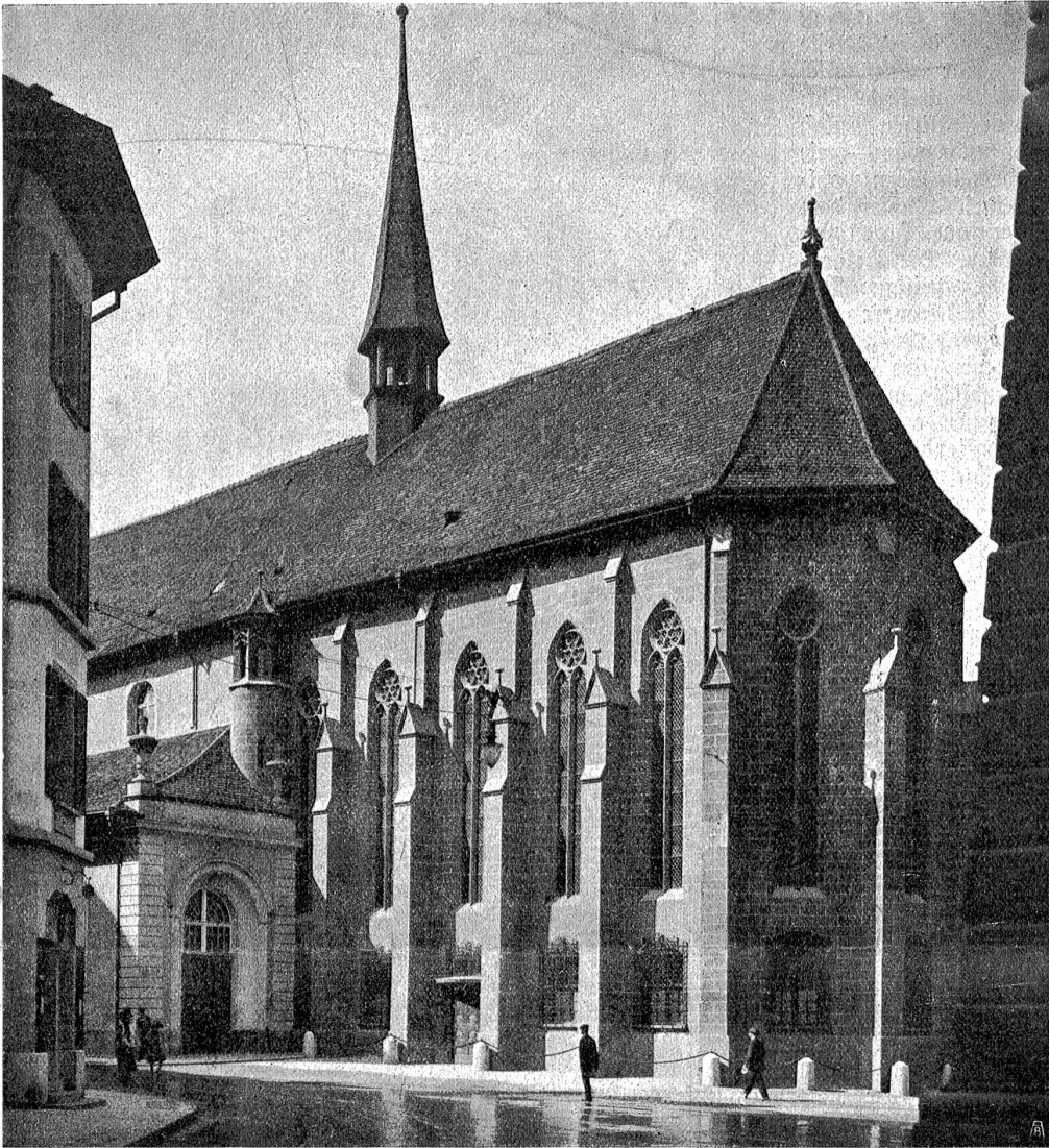
französische Kirche: Chor nach der Restauration.

vergitterter Fenster und auf der Südseite ein Eingang erstellt, dessen bronzenene Türe und skulpturengeschmückte Pfosten besondere Aufmerksamkeit verdienen.