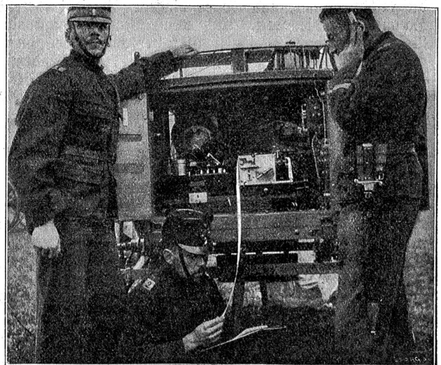
Drahtlose Feldtelegraphie: Empfängerstation; ein Soldat liest die eingetroffene Streifendepesche, der andere kontrolliert den Inhalt mittelst des Telephons.

Soviel über den derzeitigen Stand der schweizerischen Radiotelegraphie. Ob sie eine dauernde Einrichtung in unserem Heere werden wird, muß die Zukunft lehren. Gegenwärtig hat der Bundesrat aus militärischen Gründen die Benützung der in unserem Lande bestehenden Stationen für drahtlose Telegraphie und die Errichtung solcher Anlagen verboten. Das gleiche Verbot haben sämtliche kriegführenden Staaten für den Betrieb privater Stationen in ihren Ländern erlassen. Immerhin dürfte die Funkentelegraphie für die Zwecke der Kriegführung gerade im gegenwärtigen Völkerringen unschätzbare Dienste leisten. Ist es doch eine