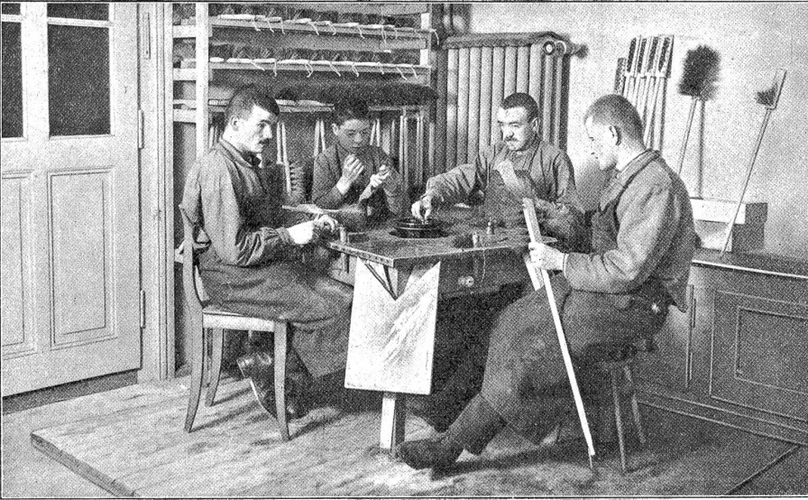
Blindenheim an der Neufeldstrasse: Pecherei in der Bürstenfabrikation.

Langsam und schwerfällig verließen drei hungrige Eisbären den Bivakplatz*). Rings lag tiefer, tiefer Schnee und der Sturm trieb mit ihm und mit uns sein wildes Spiel.