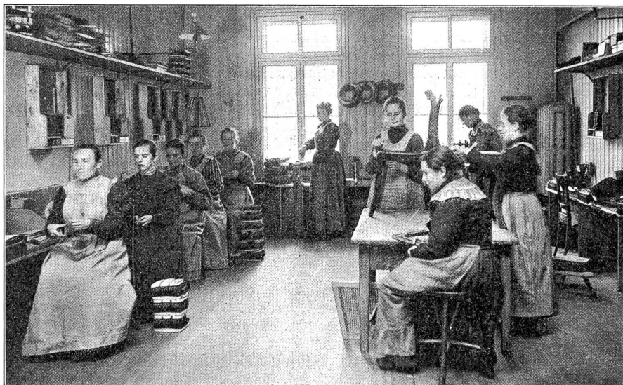
Blindenheim an der Neufeldstrasse: Bürstenfabrikation in der Frauenabteilung.

Toten, genau in der Lage, wie ich sie beschrieben hatte, und abends um zehn Uhr brachten sie Andreas Fischer. In der kleinen Kapelle neben dem großen Gasthof bahrte der