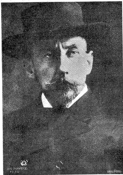
Roald Amundsen, der Entdecker des Südpols

Am 22. Nov. 1913 hat die Bundesstadt Gelegenheit gehabt, den Entdecker des Südpols unseres Planeten kennen zu lernen. Das veranlaßt uns, einen kurzen Rückblick auf den Weg zu werfen, den die Südpolarforschung zurückgelegt hat.