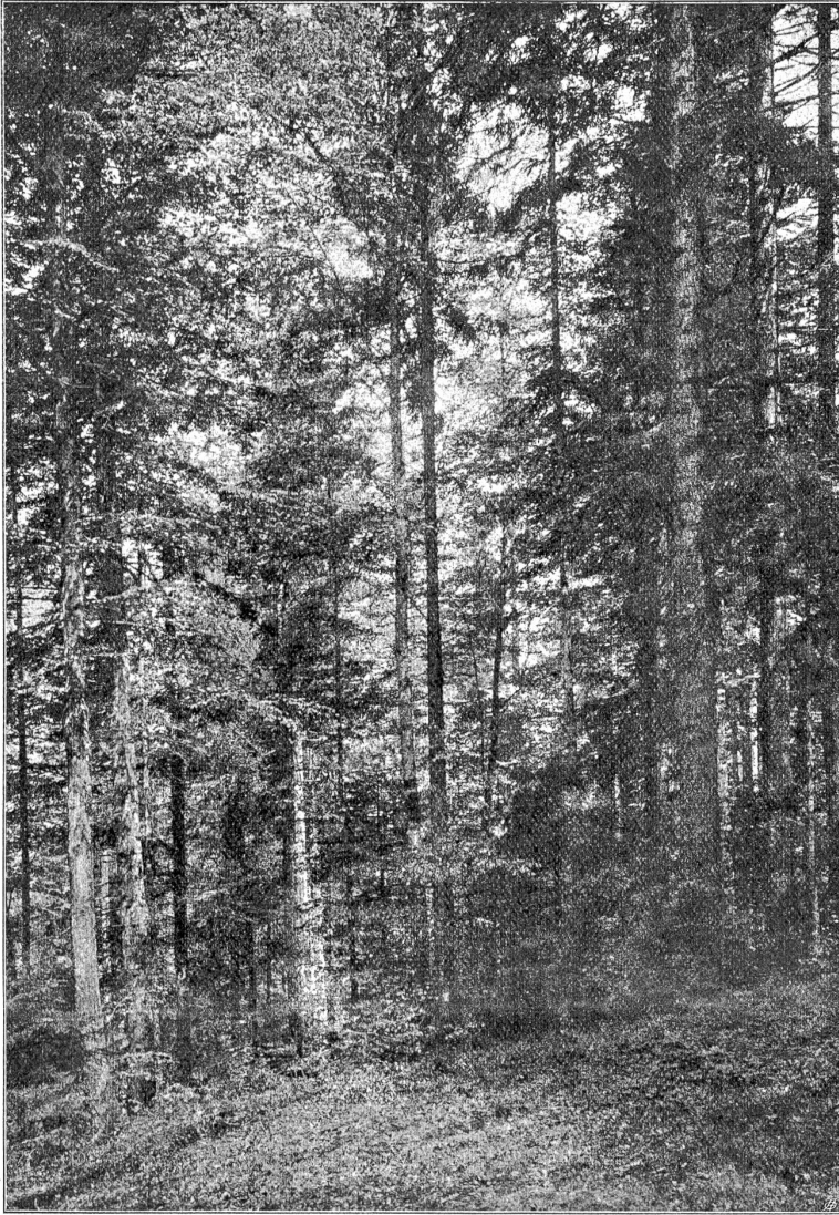
Aus dem Gemeindewald von Eriswil (Bern).