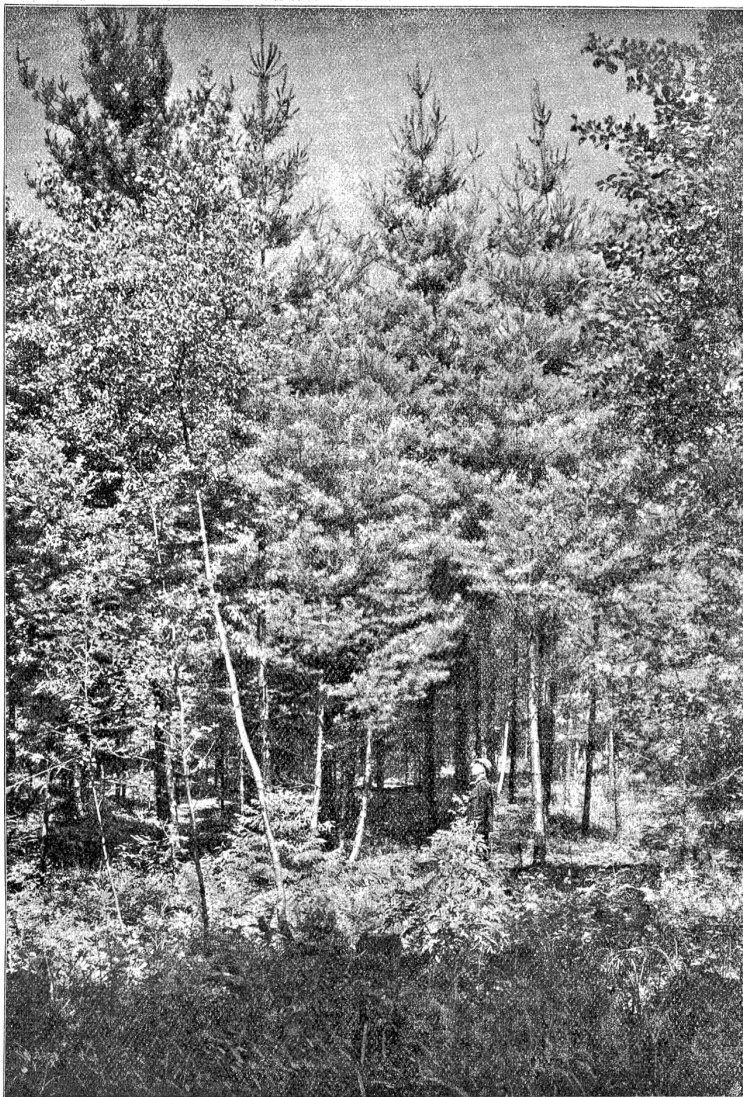
Waldpartie Rietlisberg bei Rapperswil.

Ob Bernhard des Abends noch immer die Laube der Metzgergasse hinabkam, . . . pfeifend, die Hände in den Hosentaschen, den Körper vorn übergeneigt? —