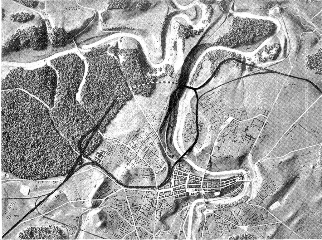
Das Liechty'sche Schleifen-Bahnprojekt für Bern.

(alle einfahrenden Züge passieren die Brücke); dann mittelst der Ausfahrtskurve, die vor dem Güterbahnhof rechts ab-schwenkt, den Neufeldtunnel passiert und auf dem Wyler links hinter dem Schiekstand und dem neuen Schlachthaus hindurch die alte Linie erreicht, ausfahren. Sie brauchte also auch nur mehr ein Geleise. Ebenso die Züge von und nach Luzern und die von und nach Thun.