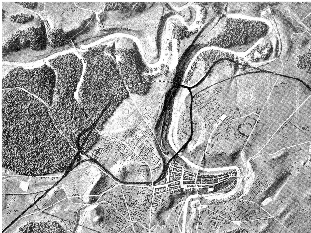
Das Liechty'sche Schleifen-Bahnhof-Projekt für Bern.

(alle einfahrenden Züge passieren die Brücke); dann mittelst der Ausfahrtskurve, die vor dem Güterbahnhof rechts ab-schwenkt, den Neufeldtunnel passiert und auf dem Wyler links hinter dem Schiekstand und dem neuen Schlachthaus hindurch die alte Linie erreicht, ausfahren. Sie brauchte also auch nur mehr ein Geleise. Ebenso die Züge von und nach Luzern und die von und nach Thun.