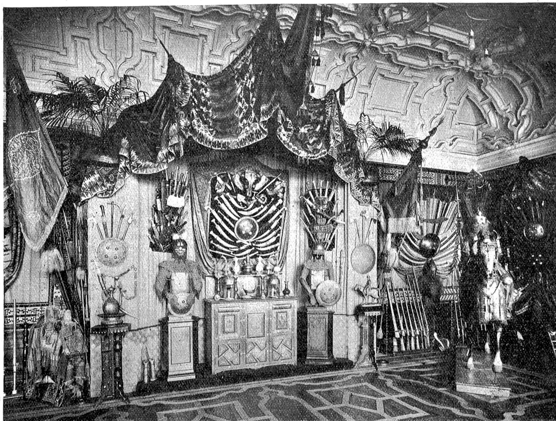
Ansicht des Waffensaaes auf Charlottenfels.

im Aeußern der vollendete Weltmann und Kosmopolit, in seinem Innersten der bescheidene und tüchtige Schweizer geblieben ist und der nun in Bern, seiner neuesten Heimat, den Ort gefunden hat, wo er seine Schätze am besten aufgehoben glaubt. Und darin soll er nicht enttäuscht werden.