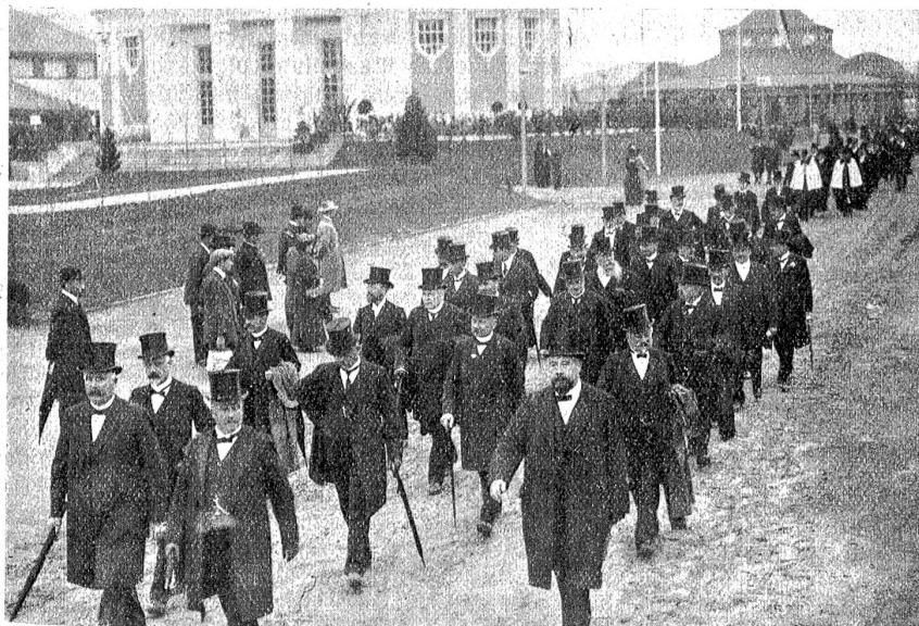
Vom Festzuge am Eröffnungstage: Die ständigen Komitees.

Man rechnet in Bern auf 3,5 Millionen Besucher; man weist hin auf die verbesserten Verkehrsverhältnisse, insbesondere auf die Anziehungskraft der Lötschbergbahn. Die Situation ist in der Tat eine ähnliche wie die 1883. Warum sollte der Lötschberg der Berner Ausstellung nicht bringen, was der Gotthard der Zürcher Ausstellung gebracht hat: den Fremdenstrom und den klingenden Erfolg? Dieses letztere liegt eben nicht einzig in den Geldsummen, die durch die Besucher in der Landesausstellung zurückgelassen werden als Eintritts- und Kaufgelder. Daß