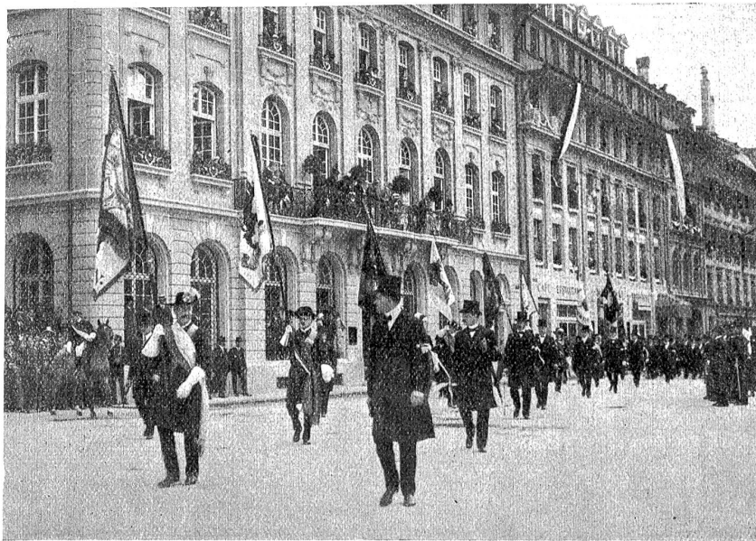
Vom Festzuge am Eröffnungstage: Die Zünfte der Stadt Bern.

über 3,5 Millionen; Besucherzahl 1,760,000 und 2,288,000, Aussteller 7500 und 7687, ausgestellte Werte 8,600,000 Franken und 17,650,000 Fr. Ueberschuß in Zürich Fran-