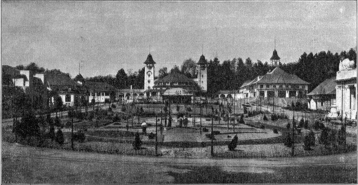
Schweizerische Landesausstellung, Bern 1914: Gartenbau, Restaurant „Cerevisia“, Feijtaal, großes Restaurant, Kinematograph u. s. w.