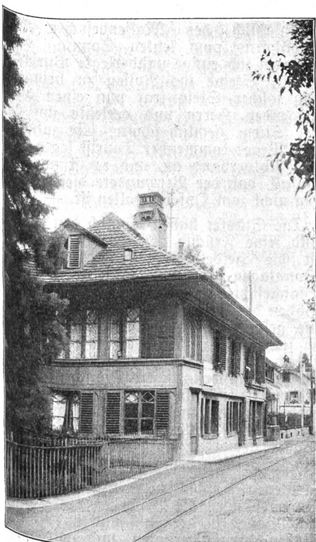
Das Brahmshaus in Thun.

Vom 1. Juli weg wurde die Fleischration der Truppen an der Grenze von täglich 300 Gramm auf täglich 200 Gramm herabgesetzt. —