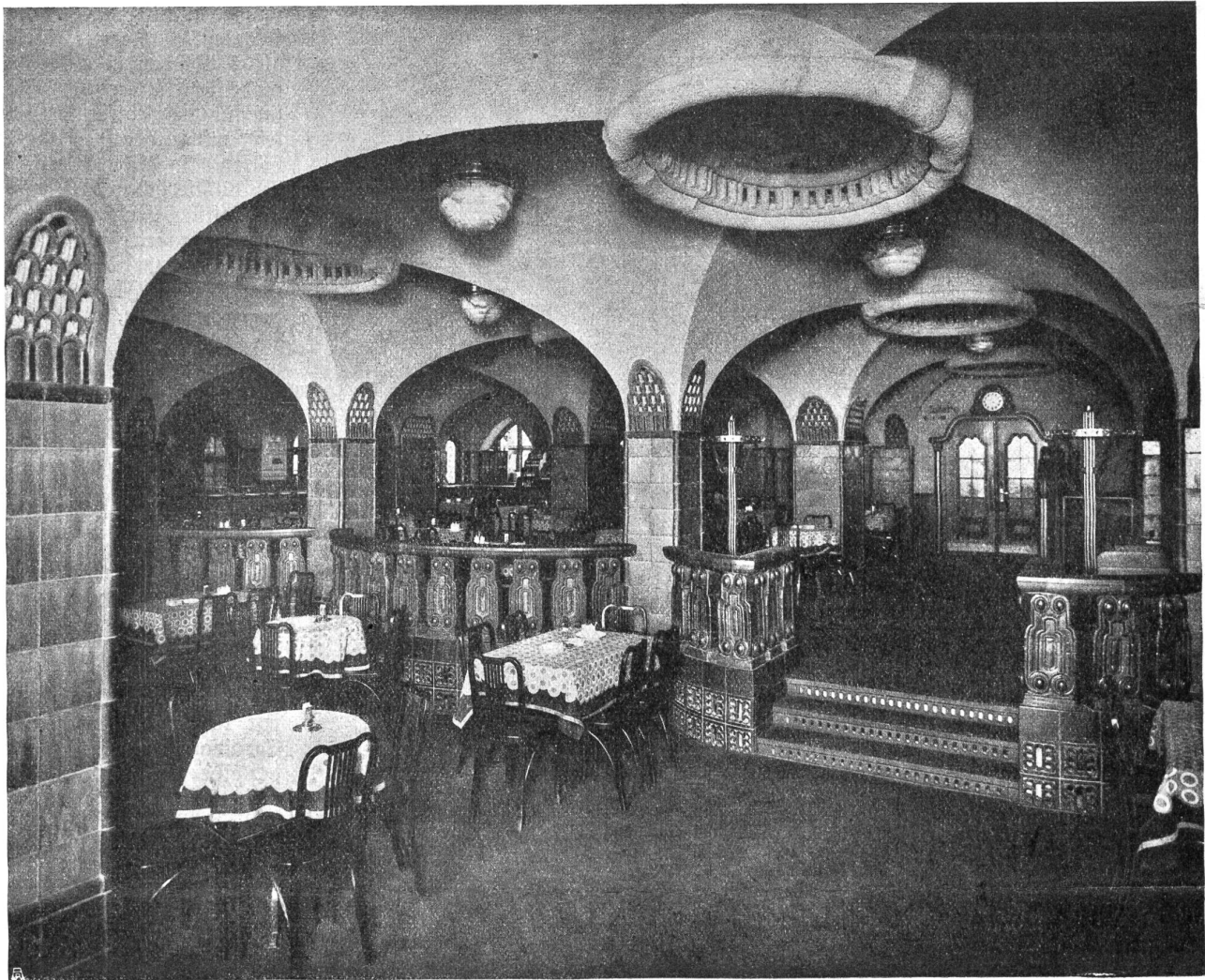
Volkshaus Bern. Restaurant.

fromm, froh und frei seine eigene Melodie heruntergeigt. Darin liegt meines Erachtens das grundföhllich so Wichtige dieses Baues, daß er ein kühner und ganzer Schritt aus dem bisherigen abgefahrenen Geleise hinaus ist; und wer vor dieser Volkshausfassade steht, der muß von einem wunderfrohen Glauben an die Zukunft erfüllt werden. Nicht rückwärts, sondern vorwärtschauend ist sie erschaffen worden. Und in dieser edlen Aufteilung der riesigen Fläche, in den zarten Verhältnissen der einzelnen Teile zueinander, in der felsharten Bindung des zu einem einzigen Stück verschmolzenen, an sich ja keineswegs edlen Materials, den stark ausbuchtenden, monumental aufgerissenen Säulen liegt eine so frohe Botschaft über die innere Gesekzmäßigkeit, die Kraft und Schönheit des Neuen, Kommenden, daß man glaubensmutig aufs neue bereit ist, an diesem Kommenden zu arbeiten. Und was könnte uns die Kunst Besseres zu geben haben als diese Arbeitslust?