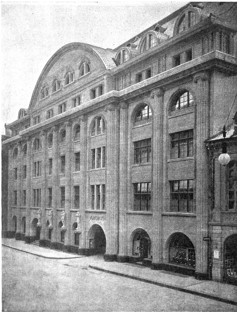
Volkshaus Bern, Sassade.

Bleich vor Zorn und Erregung las Jonas den Zweizeilenbericht seines Freundes. Mit einem Mal hob er den silbernen Briefbeschwerer auf und schmiß ihn in die schlanke Blumenvase, die alle Farben eines venezianischen Sonnenunterganges wiederpiegelte. Irmas Lieblingsstück, das sie von einer Schulreise aus Venedig heimgebracht hatte. Was sollte ein so duftiges, gedankenartes Seelenaltärlein in einer so nüchternen Umgebung, in der inskünftig nur noch die schlaue, rücksichtslose Berechnung regieren sollte? Klirr lag das Farbenwunder in Scherben. Jonas aber schrieb einen Brief an die Wettbewerbsbehörde, in dem er geltend machte, daß in seiner Berechnung ein Irrtum unterlaufen sei, daß er sein Angebot um die Hälfte herabsetze. Er