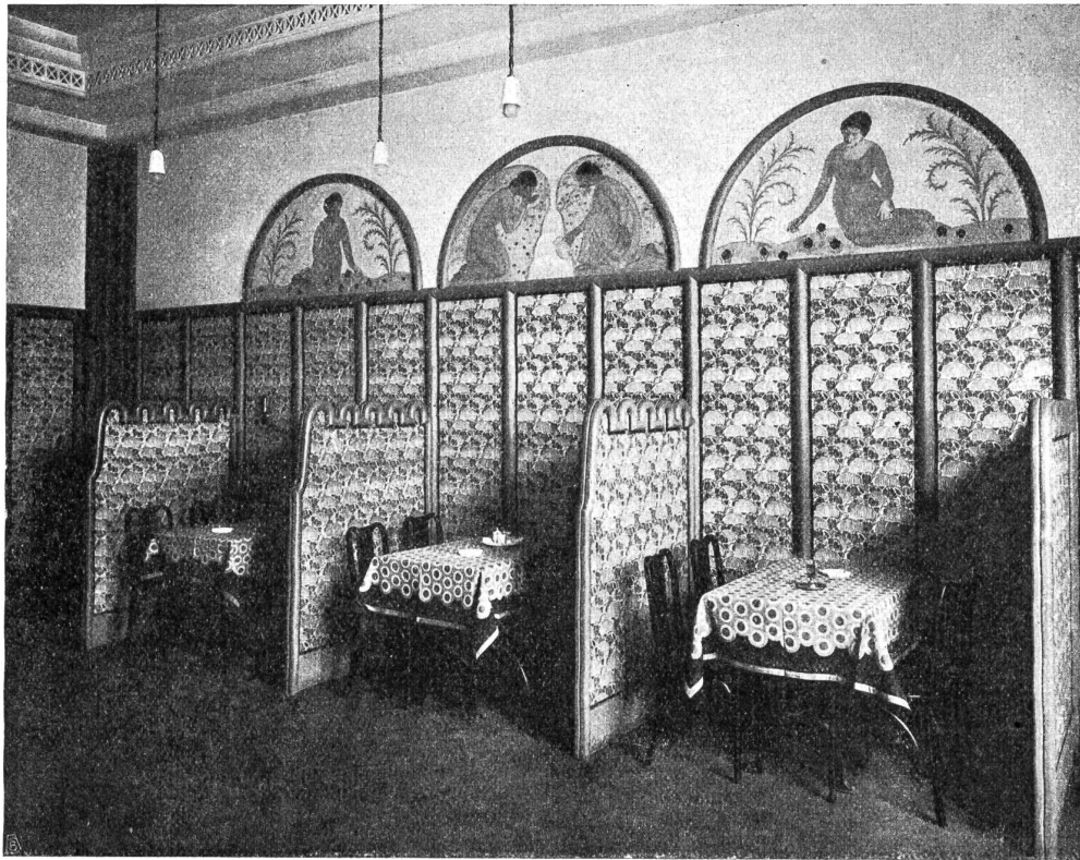
Volkshaus Bern. Alkoholfreies Restaurant.

Nichts natürlicher als eine Harmonie; nur der, der sie schaffen muß, weiß, wieviel „Kleinarbeit“ es bedarf, bis sie vorhanden ist. Das ist es ja auch, das einem bei diesem Bau immer wieder auffällt, die hingebende Sorgfalt des Architekten für jede „Kleinigkeit“. Er weiß: in der Kunst gibt es nichts Kleines, nur das Kleinliche ist unkünstlerisch. Mit derselben Sicherheit, mit der er die monumentale Fassade aufreißt, baut er ein kleines Buffet, umschreibt er die Form einer Wanduhr, und aus dem räumlich Kleinen, wie aus dem Mächtigen spricht dieselbe Beschränkung auf das absolut Notwendige, Sinngemäße.