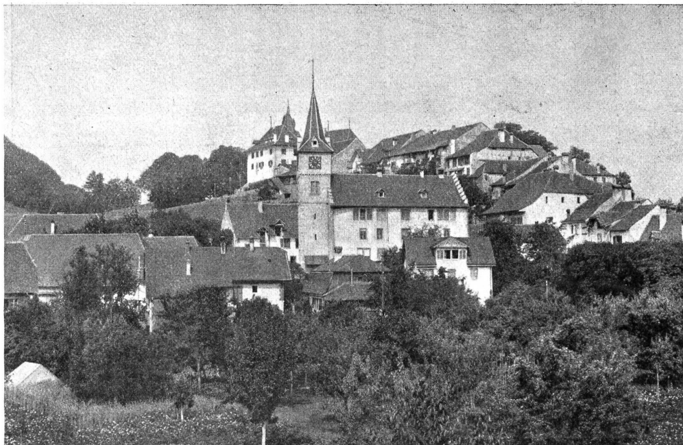
Erlach vor dem Brande.

Freundlich kam Breneli aus Rauch und Qualm ihm entgegengesprungen, glühend von Schweiß und Arbeit. „Gut,“ sagte es, „kommt, wann ihr wollt; es ist alles weg und lieb ist's mir gar sehr, wenn es mit der Arbeit nicht geht bis tief in die Nacht hinein; habe es an diesem Tage sehr ungern, denn gewöhnlich geschieht noch etwas Ungeheures. Aber zu tun haben wir gehabt, du glaubst es nicht; wäre die Base nicht gekommen und hätte mir geholfen, ich darf nicht sagen wie, du hättest mich nicht mehr gefunden: ich wäre davongelaufen, so weit mich die Beine hätten tragen wollen. Komm und sieh, was wir geschafft.“ „Muß gehen und helfen,“ sagte Uli, „die Pferde sind nicht ausgepannt, müssen noch gepuht und abgerieben sein.“ — „Wärest mir ein schöner Meister, wenn du immer dabei sein müßtest, wenn der Wagen laufen soll, und nicht einen Augenblick Zeit hättest, zu sehen, was dir deine Frau