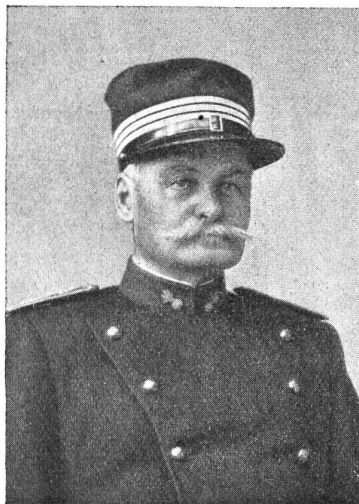
† Oberst Alfred von Steiger.

Im November 1914 feierte Oberst von Steiger sein vierzigjähriges Dienstjubiläum und wurde bei diesem Anlaß seitens des Bundesrates in üblicher