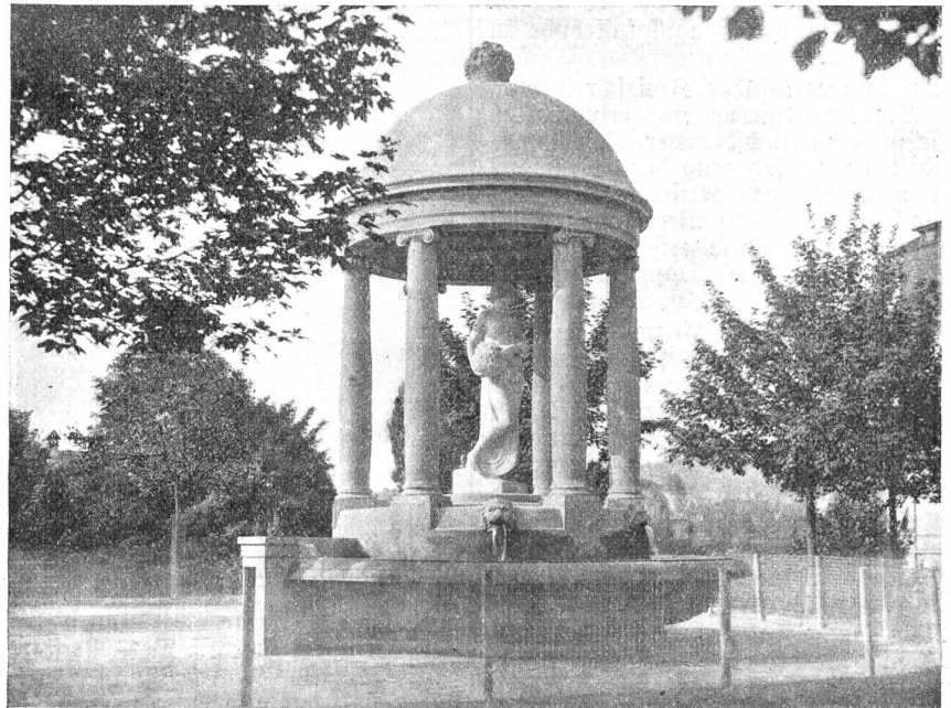
Ein glücklicher Gedanke war es, den Monumentalbrunnen, der während der Schweiz. Landesausstellung vor dem Restaurant „Studerstein“ stand, unserer Stadt zu erhalten. Er steht heute in reizvoller Umgebung auf der Promenade südlich des Montbijou-Schulhauses, Ecke Sulgeneckstrasse-Schwarztorstrasse.

Wie seinerzeit gemeldet, hat der amerikanische Gesandte in der Schweiz, M. Pleasant Stovall in Bern, die in der Schweiz lebenden Amerikaner aufgefordert, Beiträge zu einem der Schweiz zu schenkenden Soldatenheim zu sammeln. Dieser liebenswürdigen Einladung ist ein amerikanischer Bürger, Herr Carlos Lembke in Cadex, in der Weise nachge-