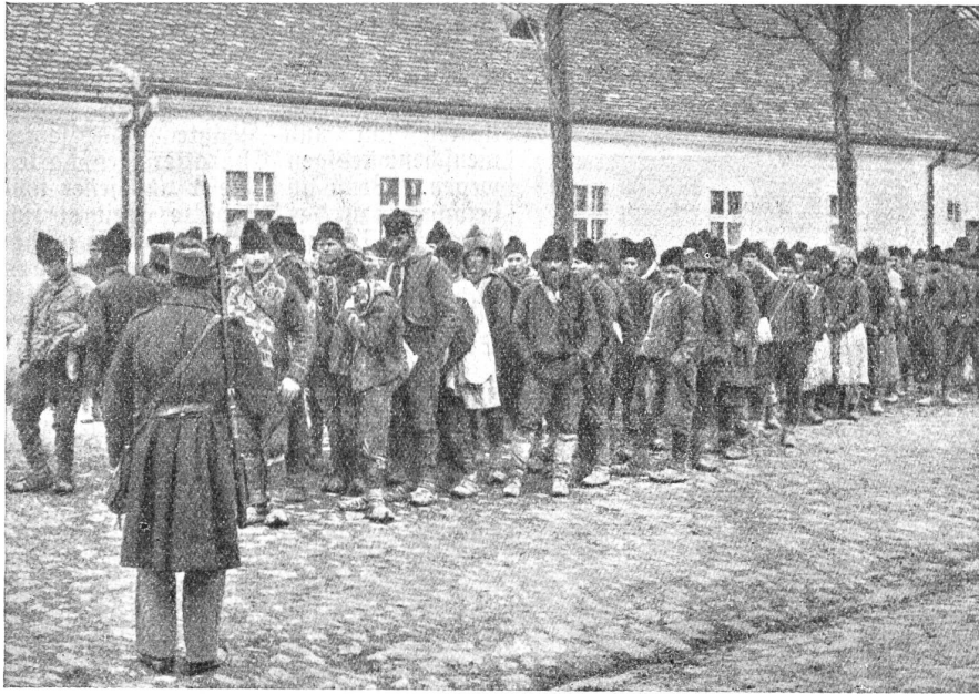
Ein Zug von gefangenen serbischen Komitadschi