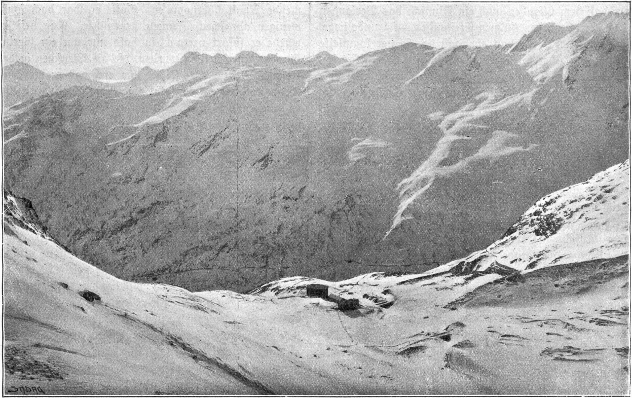
Die Bergwelt des Grossen St. Bernhard.