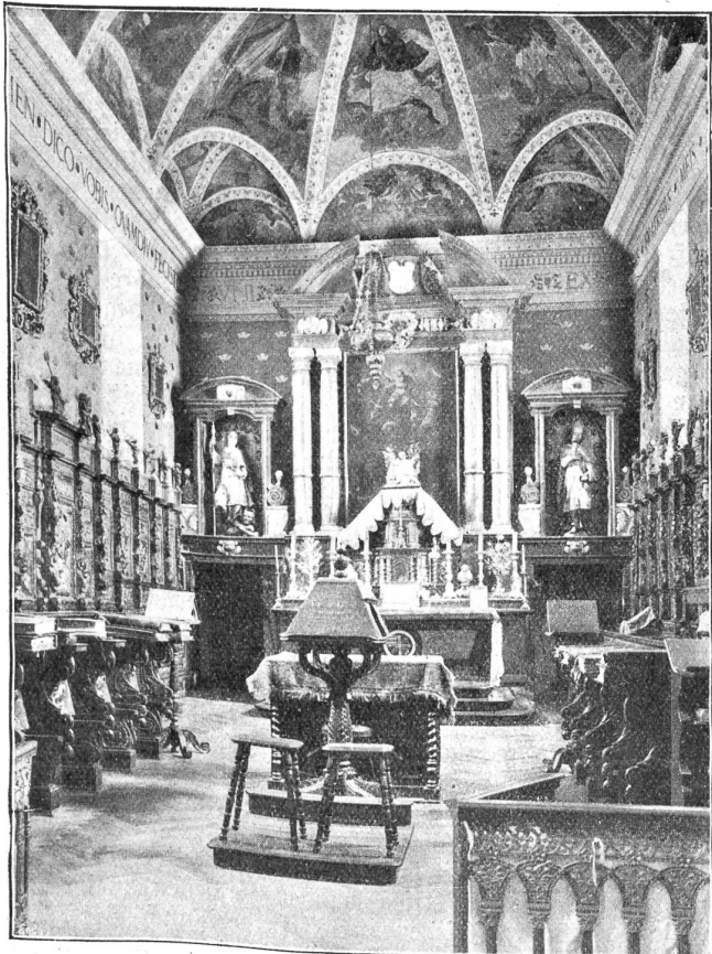
Das Innere der Klosterkirche auf dem Grossen St. Bernhard.

Die Leistung Napoleons muß nicht nach den heutigen Verhältnissen bemessen werden. Der ehemalige Saumpfad ist seither zu einer bequemen Fahrstraße ausgebaut worden. Im Jahre 1893 ward die Walliser Seite, 1905 erst die italienische Seite fertig. Heute böte ein Heeresübergang dem besseren Wege entsprechend viel weniger Schwierigkeiten. (Schluß folgt.)