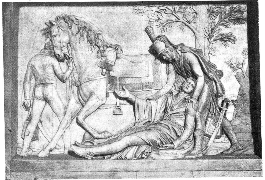
Das Denkmal des in der Schlacht bei Marengo am 16. Juni 1800 gefallenen französischen Generals Dassaix in der Klosterkirche des Hospiz.

Das Mittelalter alsdann sah die vielen fränkischen und deutschen Könige mit ihren Begleitern und Heeren über den Großen St. Bernhard nach Italien ziehen zur Kaiserkrönung nach Rom. Ueber diesen Paß wanderten auch die zahllosen Pilgerscharen, die zur Ewigen Stadt wallfahrteten. Unzählige müde Pilger haben in den Schutzhäusern längs des Weges und später in dem Kloster der St. Bernhards-Mönche Unterkunft und Verpflegung gefunden. Und wieder groß ist die Zahl der hohen Geistlichen, die hinüber und herüber gestiegen sind und bei den Hospizmönchen gastlich bewirtet und beherbergt wurden; diese Tatsachen sind pietätvoll und fleißig aufgezeichnet worden, und ein Geschichtsforscher findet hierüber beim gelehrten Bibliothekar des Hospizes interessante Unterhaltung.