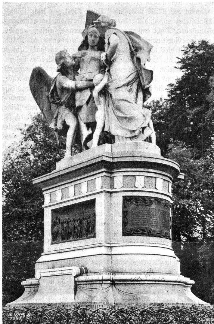
Das Strassburger Denkmal in Basel, von Aug. Friedr. Bartholdi.

Zivilbevölkerung Straßburgs Erleichterungen zu bewirken. Sie waren mit Empfehlungsschreiben des schweizerischen Bundesrates und des norddeutschen Gesandten in der Schweiz versehen und darum wurden sie vom General freundlich aufgenommen. Nach einigem Zögern gestattete er der Delegation, die deutsche Linie zu überschreiten und sich in die Stadt zu begeben. Um dies möglich zu machen, befahl er eine kurze Einstellung der Beschießung. Am Sonntag den 11. September ritten die Schweizer zu den französischen Vorposten hinüber, wo sie von einem Adjutanten des Generals Uhrich erwartet wurden. „Unter französischer Eskorte,“ heißt es im Bericht, „ging es in die Festung hinein. Hinter den Wällen tauchten massenhaft die französischen Soldaten hervor, die gerne die Gelegenheit benützen, wieder einmal ungestraft von den feindlichen Kugeln über die Wälle hinaus ins Land zu sehen; unheimlich starren einem die messingenen Schlingen in den Schießluken entgegen. Die Fallbrücke ist herunter gelassen, das große Tor öffnet sich: welch unerwartetes Schauspiel bietet sich unsern verwunderten Augen dar! Im Torweg steht dichtgedrängt