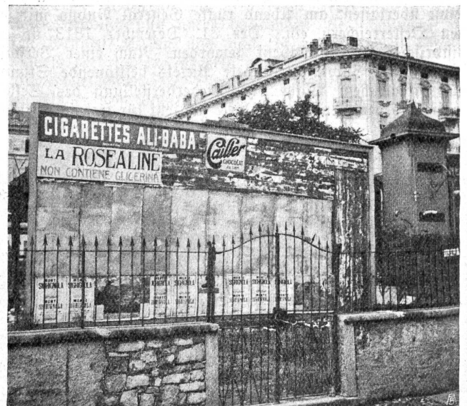
Schlecht aufgestellte Plakatwand mit ungeordnet angebrachten Plakaten. Zweifelhafter Schmuck eines Gartens.

Als Mittel für den Plakataushang haben wir in den Ortschaften, die dafür behördliche Bewilligungen erteilt ha-