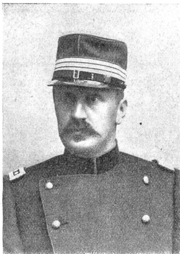
† Oberst Robert Keppler.

ße lagen, samt den Pferden eine steile Halde hinunterstürzte. Wohl wurde Blatter und ein Mitfahrender abgeschleudert, aber er kam heil davon und auch von den Pferden wurde nur eines leicht verletzt. —