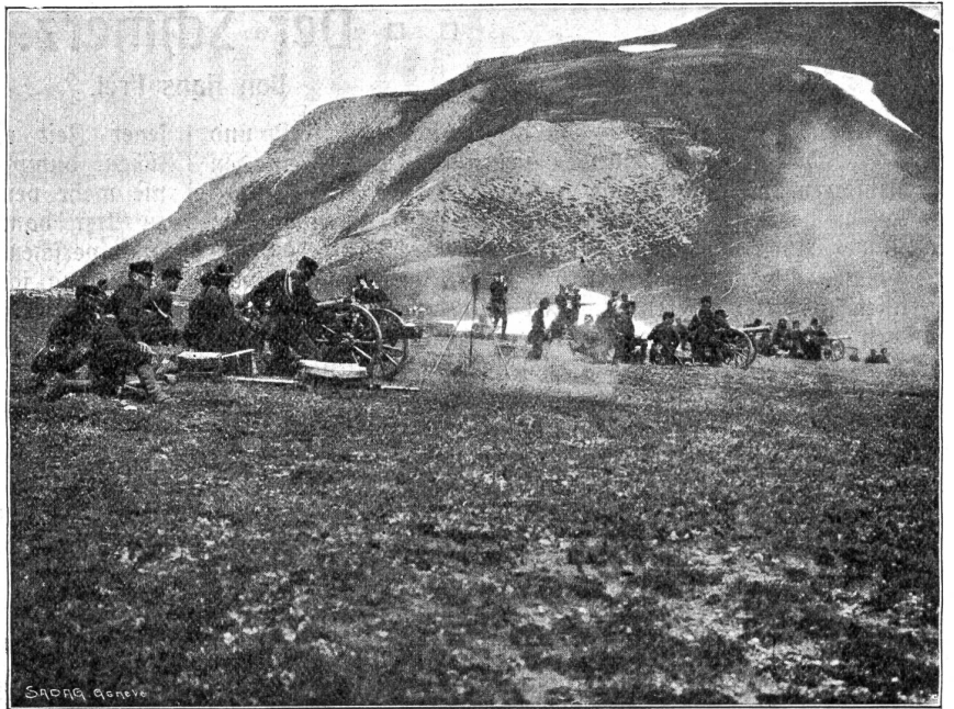
Schweiz. Gebirgsartillerie im Simplongebiet: Schiessübungen.

Säufig wird Halt gemacht. Man stellt die Temperatur fest, die Tiefe des Schnees, sucht die Berghänge nach Lawen- spuren ab, orientiert sich nach der Karte. „Auf jener