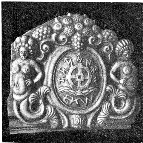
Hauswappen über dem Haupteingang. (Bildhauer Albert Grupp, Biel.)

realistisch-phantastischer symbolisch stilisierter Formen das gegebene Thema der Wasserkraft bildhauerisch behandelt.