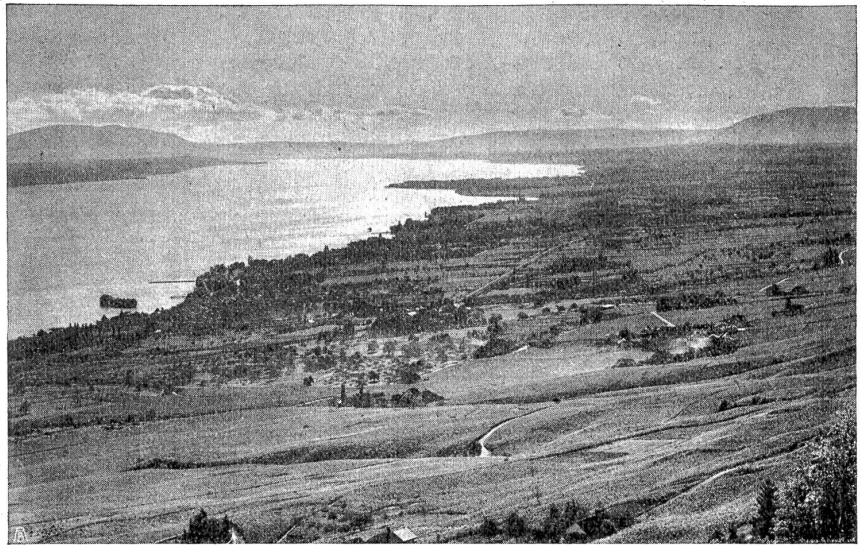
Der Genesee in seiner natürlichen Aferentwicklung.

den oder Vettern unterstützt war, hielt sich am Ende allen Widerhaken und Stacheln eines fremden Gesetzes zum Trotz und errang sich seinen Platz an der Sonne bürgerlicher Ehrbarkeit und Achtung.