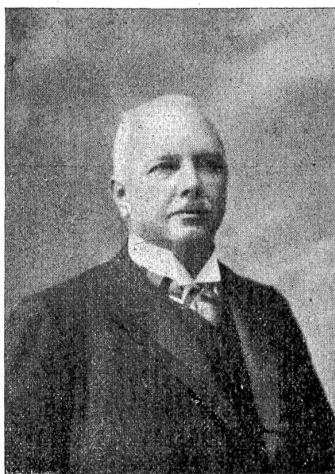
† Mit Nationalrat Ernst Wnh.

nahme der Amtsperiode von 1896 bis 1899 bis zur letzten Gesamterneuerung (1914) angehörte. Im Großen Rat war er Mitglied zahlreicher Kommissionen, Präsident der Justizkommission und 1893 Präsident des Rates. Im Nationalrat