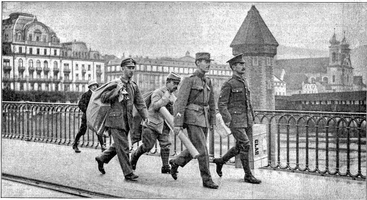
Von den Internierten in der Schweiz: Drei Internierte in Luzern, ein Franzose, ein Engländer und ein Deutscher, holen gemeinsam, unter Begleitung eines Schweizer Soldaten, die angelangten Post-Colis für ihre Kameraden ab.