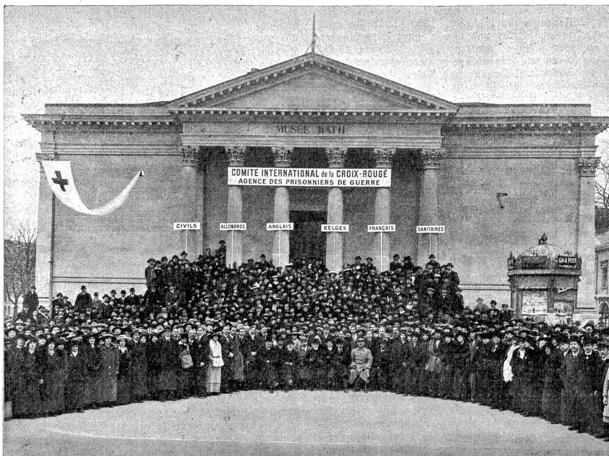
Das Personal der Internationalen Agentur für Kriegsgefangene vor dem Museum Rath in Genf.

ihren Gefangenenlagern zurückbehielten, diese den Vorschriften der Konvention entsprechend in ihre Heimatländer zurückkehren lassen. Jede humanitäre Bestrebung wird von dem Komitee unterstützt, und es nimmt ihre Organisation, wenn nötig, in die eigene Hand, so z. B. die Internierung der Kranken in der Schweiz.