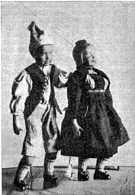
Vom Berner Puppenwettbewerb: Guggisberger Frauentracht. III. Preis.

vollendet will das Volk seine Puppen. Der Volksmund hat der Puppe (aus dem Lateinischen pupa = Mädchen, Larve,