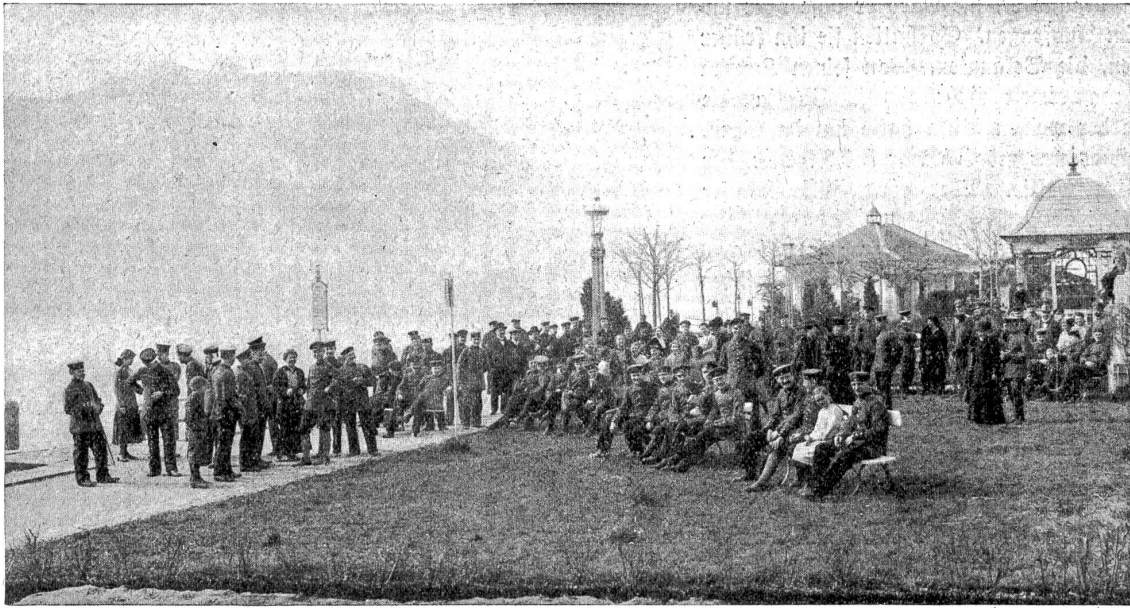
Deutsche Internierte in Weggis (Vierwaldstättersee).

(Ritzsche aus: Dr. Nagel, Liebestwerke der Schweiz im Weltkriege, Frobenius N.-G., Basel.)