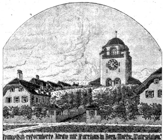
evangelisch-reformierte Kirche mit Pfarrhaus in Bern. Maler: Waldmann.

Zammerschade aber wäre es, wollte man vom Architekten eine andere als die vorgesehene ringartige Bebauung des Kirchenplatzes verlangen. Man täusche sich in diesem Falle nicht! Jetzt ist die Ansicht vom Veielihubel noch frei. Ist aber einmal das ganze Hopfgut überbaut und mit