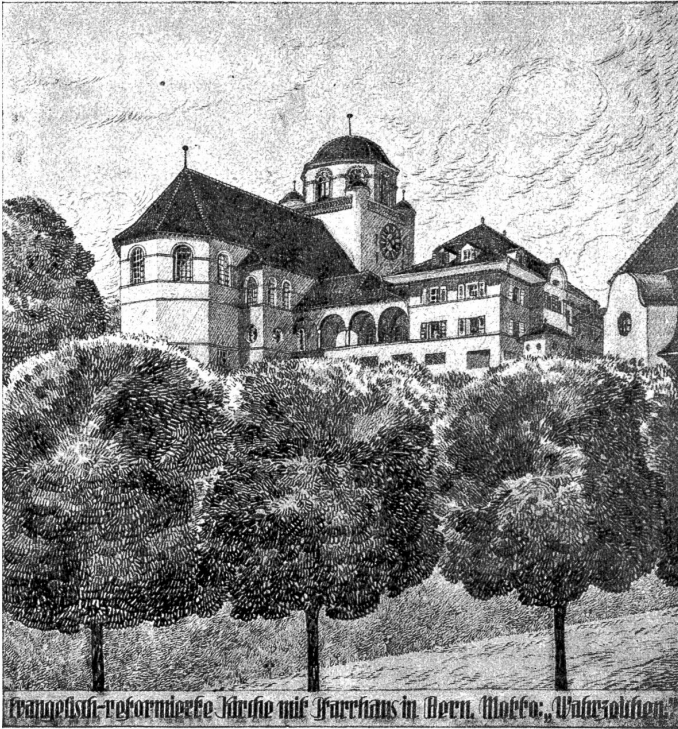
evangelisch-reformierte Kirche mit Pfarrhaus in Bern. Maler: Waldmann.

Diesem bedeutungsvollen Namen wird die Mattenhofkirche erhalten. Zur Erlangung von Plänen für den projektierten Kirchenbau war unter den im Kanton Bern nieder-