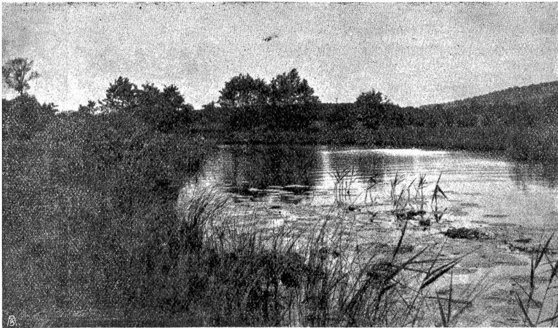
Am Hallwilersee. Sträucher und Bäume spiegeln sich im Wasser. In der stillen Bucht gebeigt, von Schilf und Seebinseln geschützt, die Seerose.