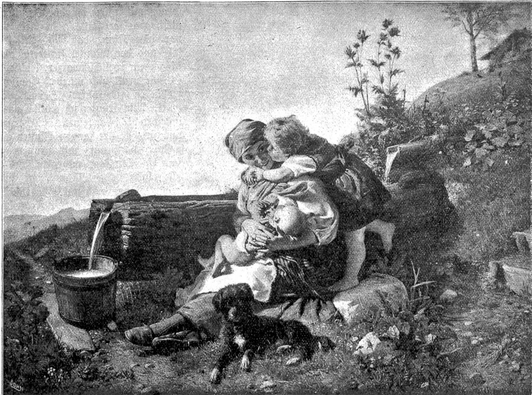
Konrad Grob (1828—1904).