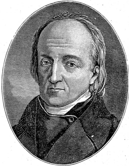
Philipp Emanuel v. Fellenberg (1771–1844).

— „So bleibt mir gar nichts zu tun übrig? Nenne mir etwas, Hanna, ich bitte dich darum! — Hast du nicht