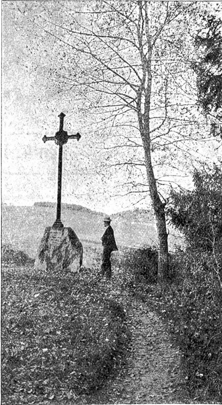
Grabkreuz bei Neuenegg.