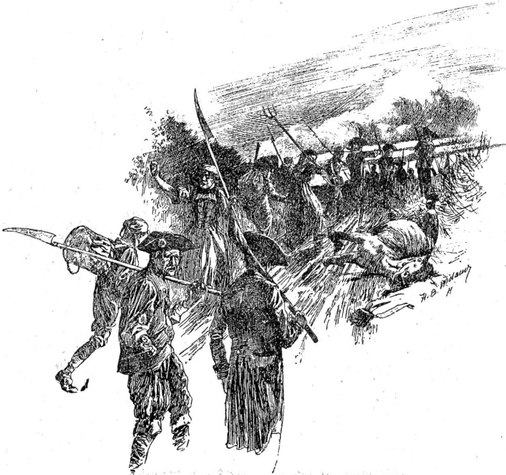
Rückzug des Landsturms am 5. März 1798.

voneinander getrennt, so daß wir uns gegenseitig nicht beachteten.