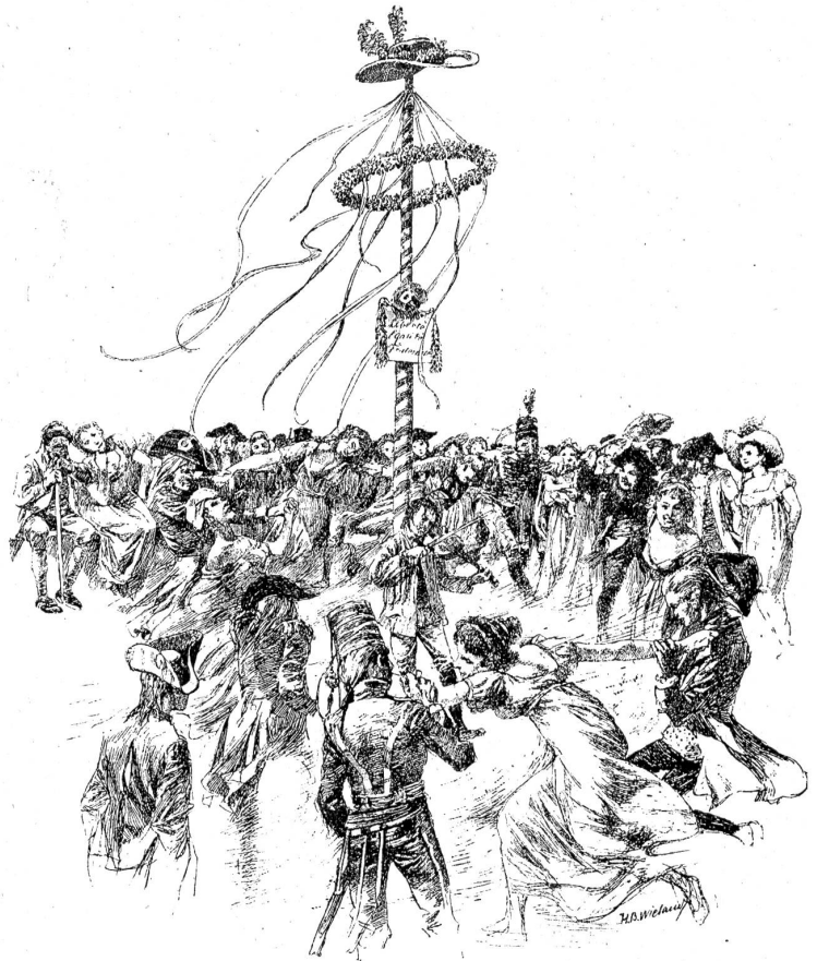
Der Canz um den Freiheitsbaum.