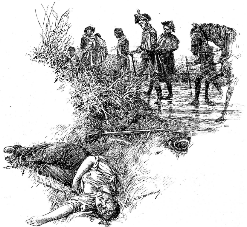
Am 5. März 1798, abends.

Halbte des Weges, so viel ich konnte, vorausgeeilt, und fand dasselbe von einem bewaffneten Unteroffizier befehlt. Ich hielt mich nun an dem einen Steigbügel, bis mir der Atem erlaubte, mich gegen den Reiter zu äußern, von dem