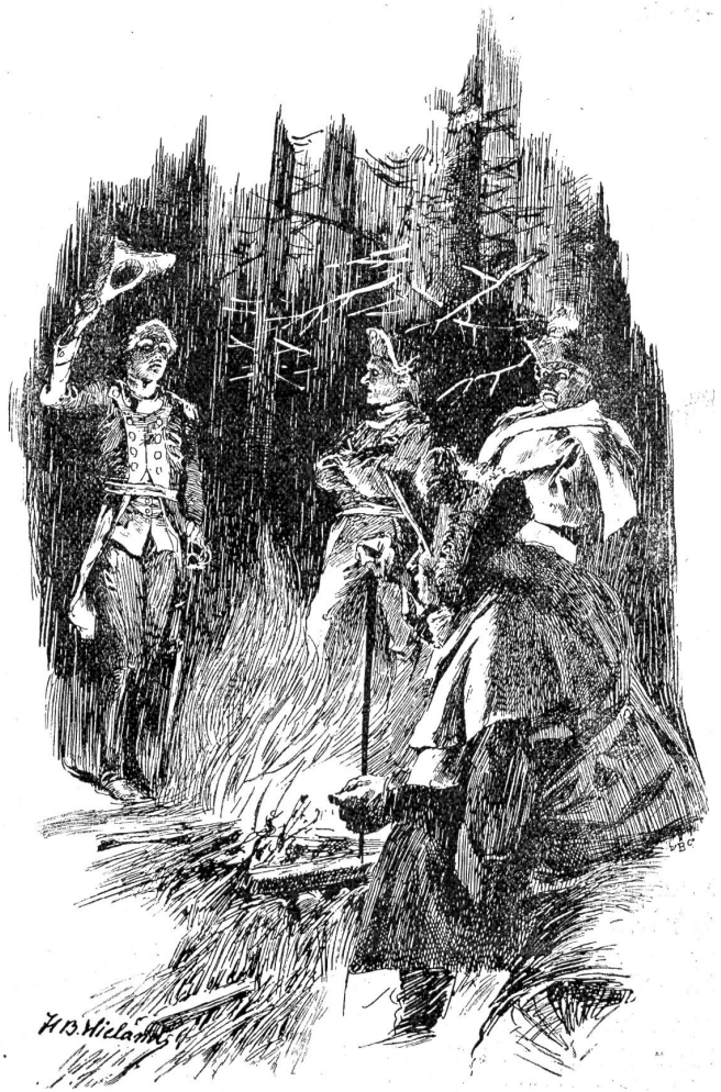
General von Erlach und seine Adjutanten in der Nacht vom 4./5. März 1798 im Grauholz.

gefahren würde, was aber nicht tunlich war, da die sechs ausgehungerten jungen Pferde die Kanone kaum im Schritte