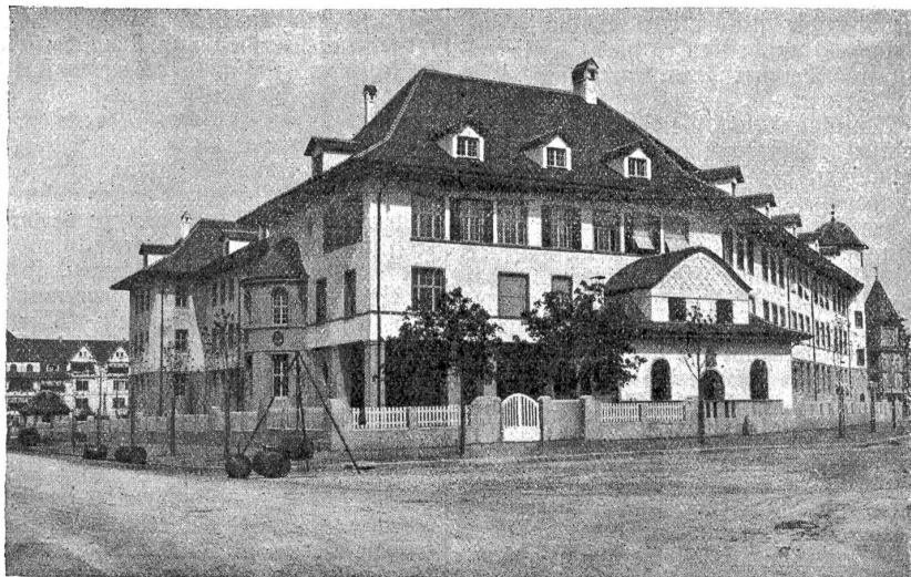
Das neue Primarschulhaus an der Weissensteinstrasse in Bern.

Raum war letzte Woche der Flieger des deutschen Heeres aus dem schweizerischen Luftraum nach Hause gefehrt, so erschienen am Donnerstag, 27. April,