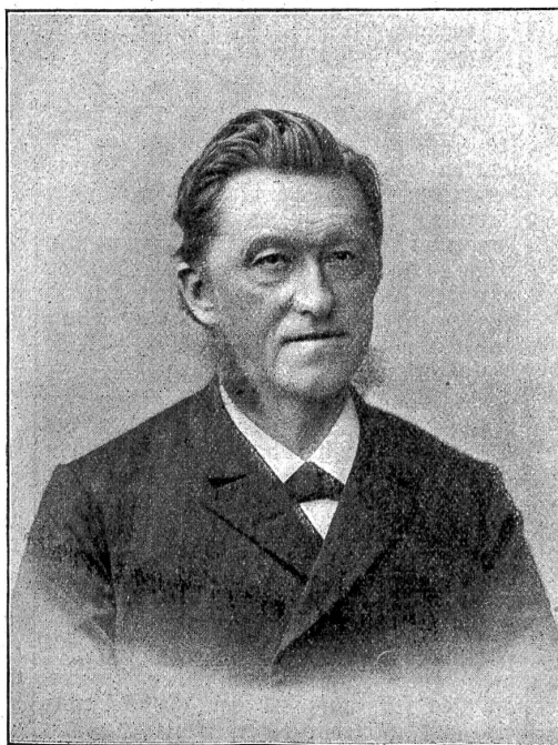
† Julius Thellung.

Letzte Woche erlitt der Dampfer „Stadt Thun“ kurz nach der Ausfahrt von der Station Gunten einen Radruck und konnte die Fahrt nicht fortsetzen. Das Schiff mußte zur Reparatur in den Dock verbracht werden und die Passagiere setzten ihre Reise per Schleppler fort.