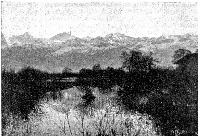
Uferpartie mit Jungfrau und Mönch.

Heute möchten wir die Aufmerksamkeit auf ein Gebiet am untern Ende des Sees lenken, das bisher als Tummelplatz der Jugend diente, im Sommer als Badestrand, im Winter als Eisbahn. Es ist dies die Strecke vom Dürrenast nach Gwatt am linken Seeufer. Als vor einigen Jahren der bisher an Sonntagen gestattete Besuch des benachbarten Schadau-Parfes verboten wurde, war man in Thun nicht gerade er-