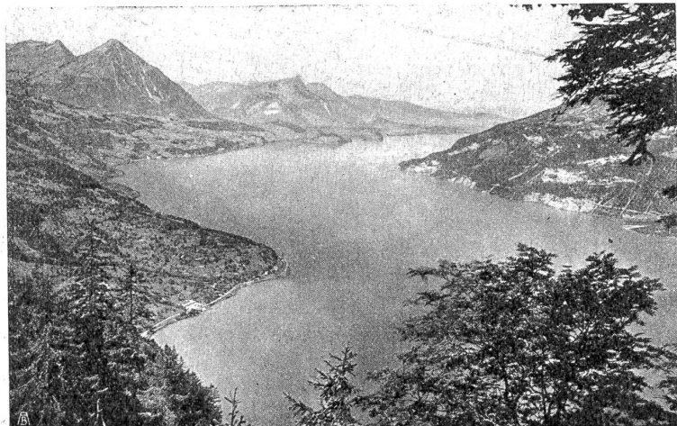
Der Thunersee vom Abendberg aus. Gesamtbild, das in seiner untersten Partie die Gegend aufweist, von der hier die Rede ist.

Vor allem sollte nun ein durchgehender Streifen des Strandes von der Wegkreuzung im Dürrenast bis zur Bellerive-Besitzung in Gwatt gesichert werden. Am schönsten ist ein ganz einfacher Fußweg; auf der Landseite kann an