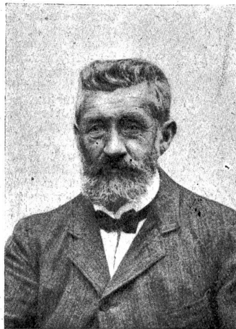
† Ed. A. Sulser.

des Kaufmännischen Vereins, sowie des Schweizer Alpenklubs und des Turnklubs Breitenrain, mit welchen er manche schöne Bergtour ausführte. Er war auch ein