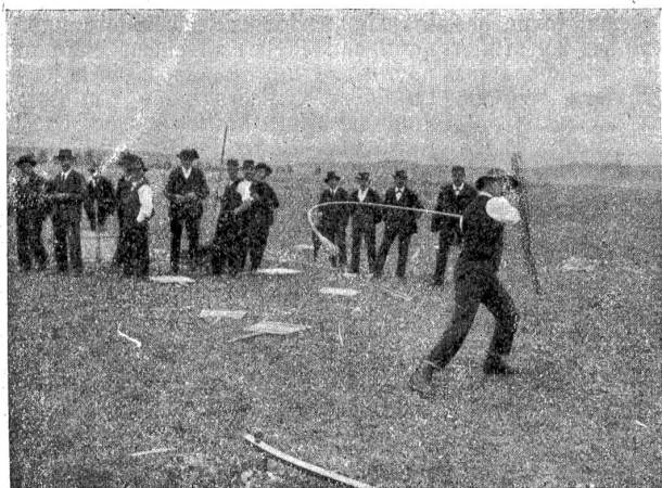
Wetthornusset in Chun 14. Mai 1916. (Joh. Frib, Zäziwil, beim Schlagen.)

Eine große und eindrucksvolle Friedenskundgebung wurde letzte Woche im Berner Münster veranstaltet, zu der