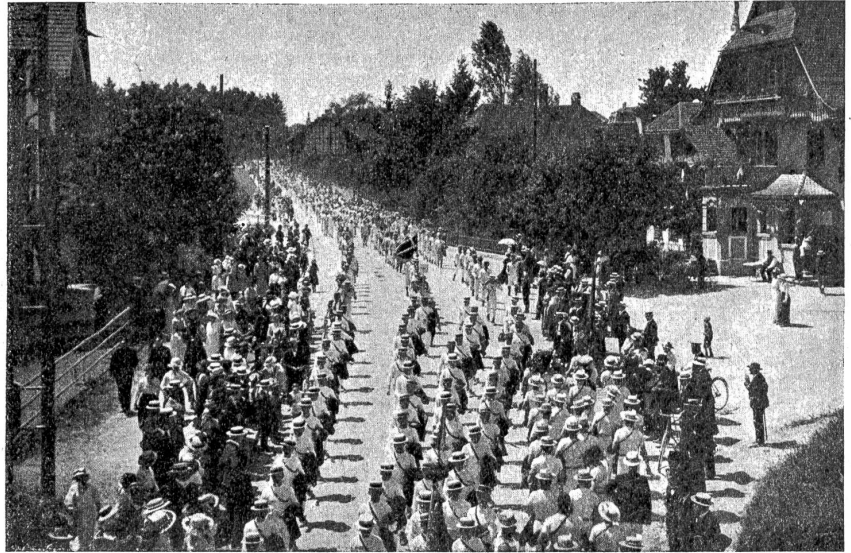
Vom Mittelländischen Turnfest in Ostermundigen — Festzug. (Text siehe Seite 263.)

Von den von den Schweizerischen Bundesbahnen bestellten neuen Güterwagen werden demnächst 100 dem Verkehr übergeben werden.