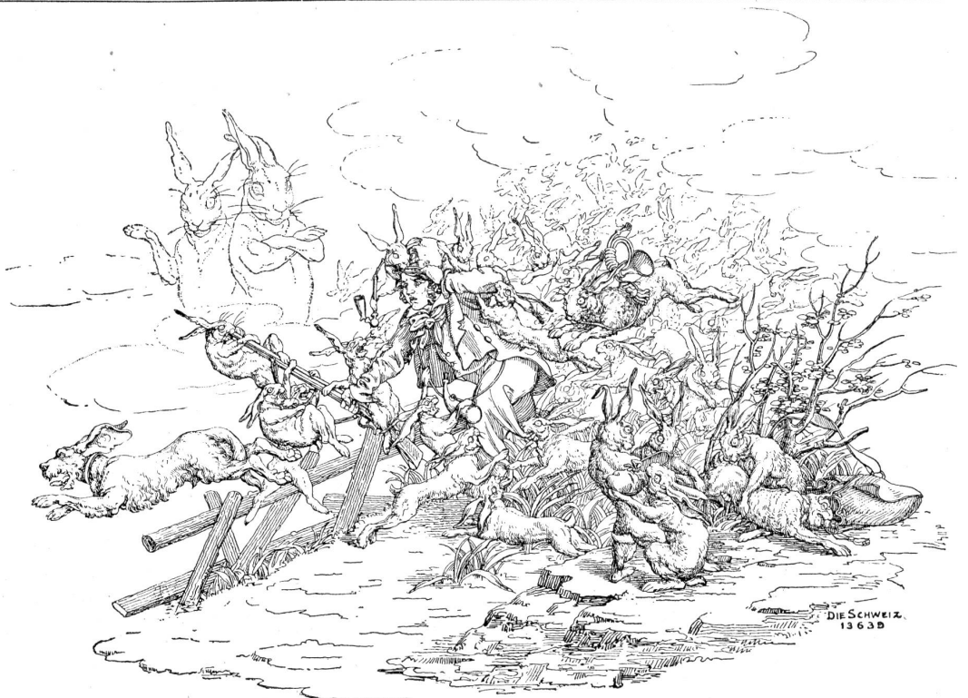
Martin Disteli: Der tolle Jäger. Die Hasen nehmen Rache an ihrem Verfolger und bringen ihn zur Verzweiflung.