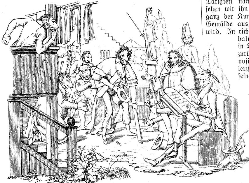
M. Disteli: Der Liebesmäntler. Der Fuchs verwedelt als Advokat die Spuren seines Veters.

Der junge Mann, der durch den Ersatz dieses seines ersten „öffentlichen Auftretens“ seinen Weg vorgezeichnet findet, ist kein anderer als Martin Disteli, geboren zu Olten im Jahr 1802. Er sollte sich dem Staatsdienst widmen und begab sich zur Vorbereitung auf seine zukünftige Tätigkeit nach Freiburg i. Br., dann nach Jena. Bald sehen wir ihn in der Münchener Akademie, wo er sich nun ganz der Kunst widmet. Dort führt er sein erstes großes Gemälde aus, das von der Kritik günstig aufgenommen wird. In richtiger Erkenntnis seiner Stärke entragt er aber bald wieder der Palette und widmet sich fortan in Olten, wohin er als relegierter Burschenschaftler zurückgekehrt ist, beinahe ausschließlich der Komposition. In seinen Stoffen durchaus nicht wählerisch — er ist infolge ökonomischer Zerrüttung seiner früher gutsituierten Familie auf den Broterwerb angewiesen — zeichnet er Aushängeschilder, Schweizer Schlachten, Illustrationen zu Schweizer Zeitschriften und zu bekannten Werken. Seine Illustrationen zum „Münchhausen“ machen Aufsehen. Er macht sich mit gleichem Geschick an Bildzyklen (Heuschrecken). Einen geachteten Namen macht sich Disteli durch seine Zeichnungen zu den Fabeln des bekannten Schweizer Dichters Abr. Emanuel Fröhlich. Aber alle seine frühern Leistungen werden in den Schatten gestellt durch den seit 1839 herausgegebenen Kalender, der seinen Namen trägt und im ganzen Schweizerland großes Aufsehen erregt. Durch die geistreichsten und witzigsten