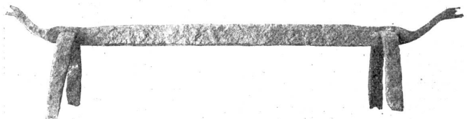
Seuerbock aus der Zibl.

nur mit einer kritischen Fundstatistik über die verschiedenen Epochen, sondern er läßt es sich angelegen sein, durch Hinweise auf die neueste in- und ausländische Literatur die Forschung zu fördern und zu beleben. Während so die jährlichen Vorkommnisse festgehalten werden, hat unterdessen D. Viollier ein auf eigenen Ausgrabungen und Forschungen beruhendes Werk über die Gräber der Latènezeit im schweizerischen Mittellande erscheinen lassen, das zu den wichtigsten Veröffentlichungen auf diesem Gebiete gerechnet werden muß. Es ist von der Stiftung von Schnyder von Wartensee herausgegeben worden und als Teil eines mehrbändigen Werkes gedacht, welchem der Verfasser den Titel gibt: Les civilisations primitives de la Suisse.