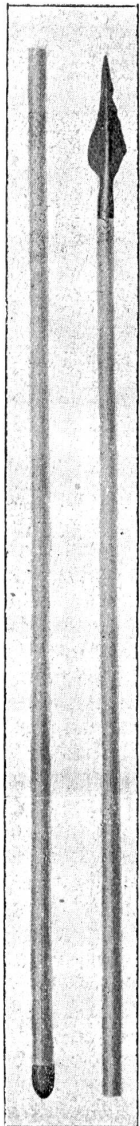
Latène, Lanzenspitze mit Schaft.

Menge Fundberichte und wissenschaftliche Einzelabhandlungen sind aus seiner Feder geflossen, die sich alle durch Genauigkeit und Klarheit auszeichnen. Erst nachdem er sich