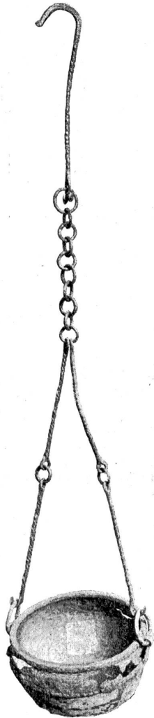
Kessel aus Bronze mit Baken aus Latène.

auf diesem methodisch sichern Wege den Ueberblick über das Material und die Literatur verschafft hat, ist er an die Ausarbeitung eines größeren zusammenfassenden Werkes geschritten. Es behandelt die Gräber der zweiten Eisenzeit oder Latènezeit, die man allgemein in die Jahre 400–50 vor Christus zu setzen pflegt. Nach dem Vorgange von Oskar Montelius sucht er aus den Funden eine relative Chronologie zu entwickeln, indem die Gegenstände zu typologischen Reihen zusammengestellt werden, in denen sich ältere und jüngere Typen erkennen lassen. Dies geschieht vornehmlich an dem beliebten Schmuckgegenstand der Latèneleute, der Fibel. Bei der Datierung vorgeschichtlicher Funde der Metallzeit spielt kein Gegenstand die Rolle, welche der Hefnadel oder Fibel zukommt. In der Bronzezeit entstehend, entwickelt sie sich in der ältern und jüngern Eisenzeit derartig, daß man sie getrost der Bedeutung gleichsetzen darf, welche der Knopf an der Bekleidung der Modernen hat. In einzelnen Latènegräbern wird sie auf den Skeletten in der Zahl bis zu 20 Stücken gefunden. Die Latènefibel zeigt folgende Entwicklung: In der ältesten Zeit (Latène I)