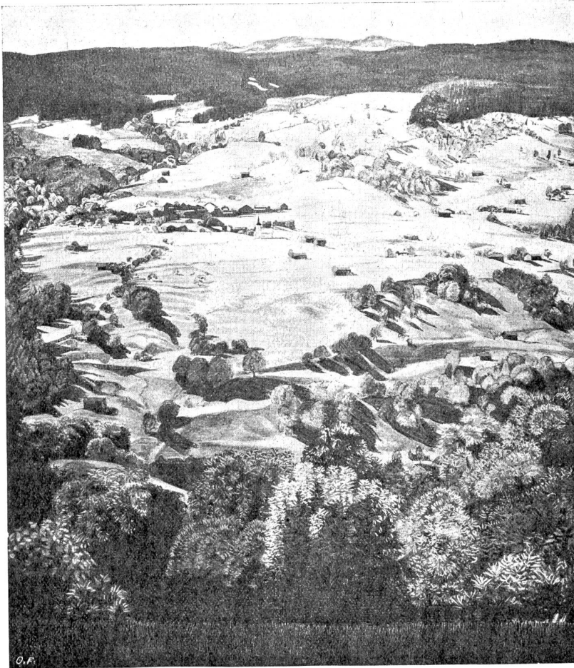
† Christian Conradin: Landschaft im Prättigau (Tempera). Schweiz. Kunstausstellung in Zürich.