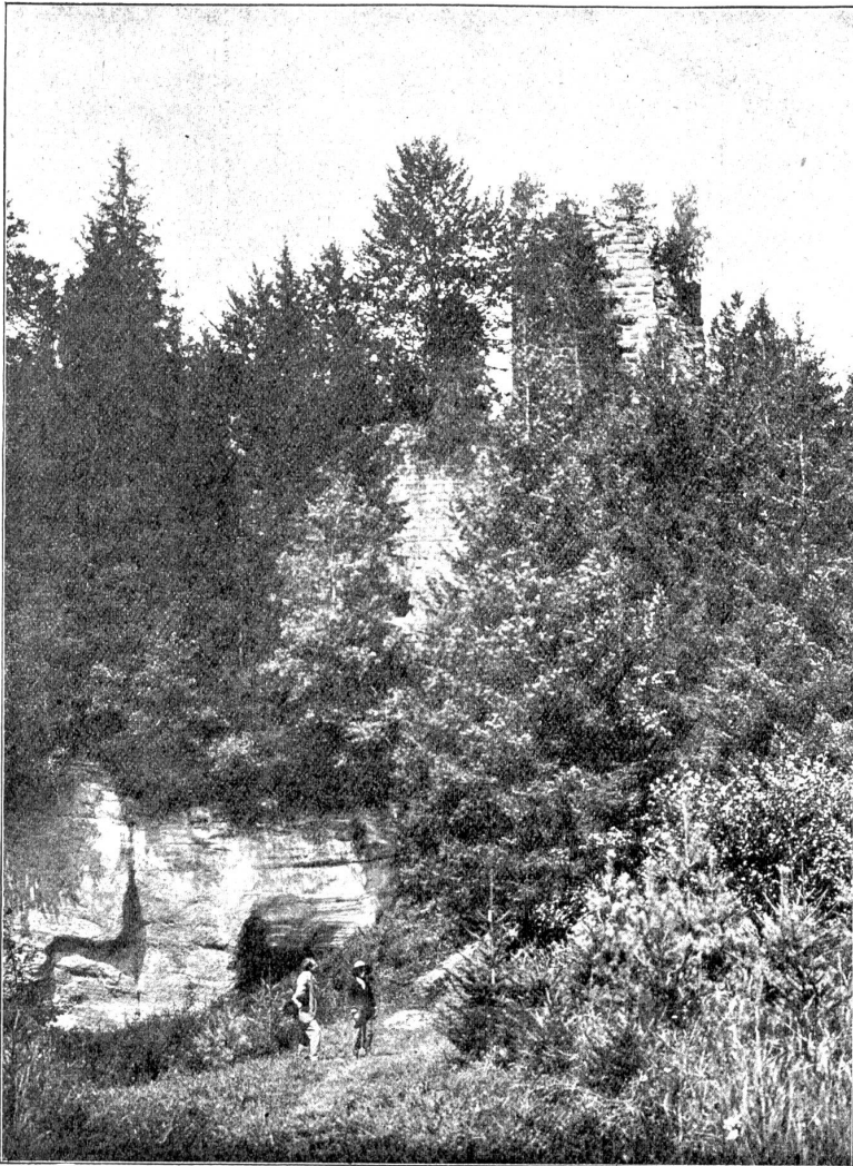
Ruine Grasburg: Die vordere Burg. Ansicht vom Burgweg aus.

Barrauds ab — und man darf das, wenn man nicht mit einer Mode geigen will —, dann bleiben recht wenige, die irgendwie anziehen. Da ist vielleicht zunächst August Giacometti, der in einer Phantasie über eine Kartoffelblüte frischweg nur Farben hinsetzt, die in wundervollem Zusammenklang miteinander wirken, alles nur ein Rausch, nur eine flammende Begeisterung, nichts Körperliches mehr, alle Linien aufgehoben, ein absolutes Bekenntnis zur Farbe, aber wie alle solche ins Neueste getriebenen Prinzipien zugleich eine Widerlegung. Ganz auf Farbe gewollt ist Cardinaux' Frauenraub, dessen sichere Gestaltung man schon vor zwei Jahren an der Weihnachts-Ausstellung in Bern bewundern konnte, das aber wie damals trotz der feinen Verwendung der Töne auf den Frauenkörpern allzuflüchtig wirkt, um den Eindruck der Kälte verjagen zu können. Da ist ferner Prochaskas Bild: Die Allee, auch wohlbekannt von einer Weihnachtsausstellung her; es hängt etwas verstaubt, ist aber unzweifelhaft eines der bedeutendsten Bilder der Ausstellung. Burkhardt Mangold bietet dies Jahr nichts Neues; seine Bilder weisen immer dieselben kindlich-frohen Farben des Regenbogens auf.