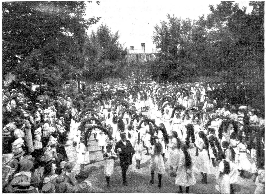
Die Solemnität in Burgdorf. Zug der Bogenträgerinnen.

An der Nachmittagsfeier bildet natürlich der große Festzug die Hauptattraktion. Welch' Augenweide ist es, die 2000 Kinder an sich vorbeidefilieren zu lassen! Voran schreitet stolz und schneidig das schmutzige, in den Stadtfarben schwarz und weiß gekleidete Knaben-, Trommler- und Pfeiferkorps, geleitet von einem Tambourmajor. Es folgen die Tellgruppe, dann die Kinder der untern Schuljahre, die Mädchen mit Brustkränzen, die Knaben vergraben in einem Wald von Hellebarden, Morgensternen und Fahnen. Und erst die tausend hübschen Mädchen der obern Primarschulklassen und der Mädchensekondarschule, alle in Weiß, Blumenbogen tragend und kunstvolle Schleifen ausführend! Wer könnte sich an diesem Bilde satt sehen! Den Schluß bildet das zweihundert „Mann“ starke Kadettenkorps. Auf der Schützenmatte sind die Spielplätze der Kinder schulfahrweise abgegrenzt, zwischen denen auch heuer ein nach tausenden zählendes Publikum hinpulsierete, Leute von nah und fern. Die Ringelreihen und Spiele der Kleinsten entzünden männiglich und die hübschen Reigen der Mädchensekondarschülerinnen finden „drängende und stoßende Beachtung“.