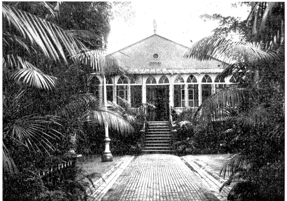
Das Museum Göldi in Pará.

studiert an der dortigen Hochschule. Nach einem Jahr öffnet sich ihm eine Lehrstelle in Jena; so kommt er zu Professor Häckel, wird sein Schüler und bald sein Assistent. Zur Vertiefung seiner Studien geht er nach Leipzig und Berlin