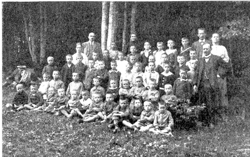
Mülhauer Kinder im Serienheim Riedbad bei Lanzenhäusern.

Vom 1. Januar bis 31. August 1917 wurden insgesamt 12,826 Schweine im